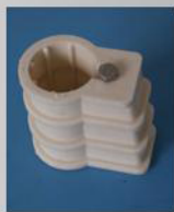
Műa betonozható talp